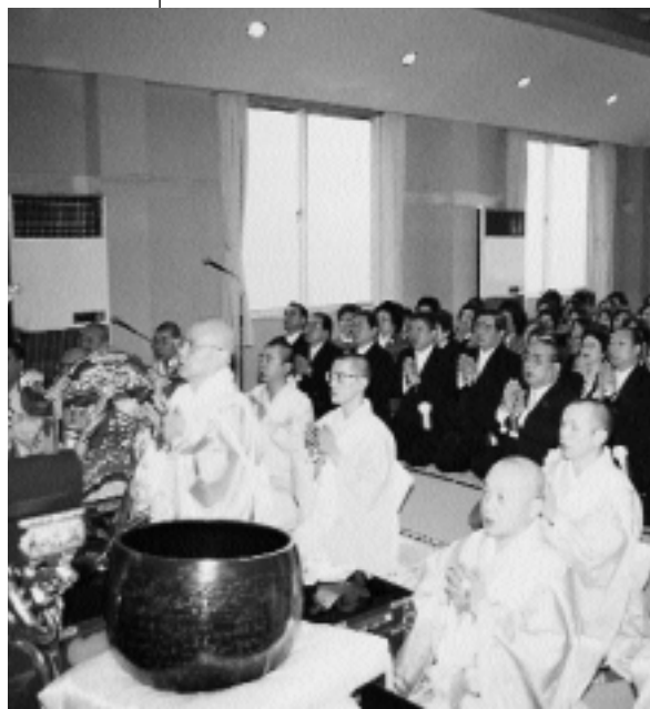
1985, Nikken inaugura il tempio Chokyu-ji, donato dalla Soka Gakkai