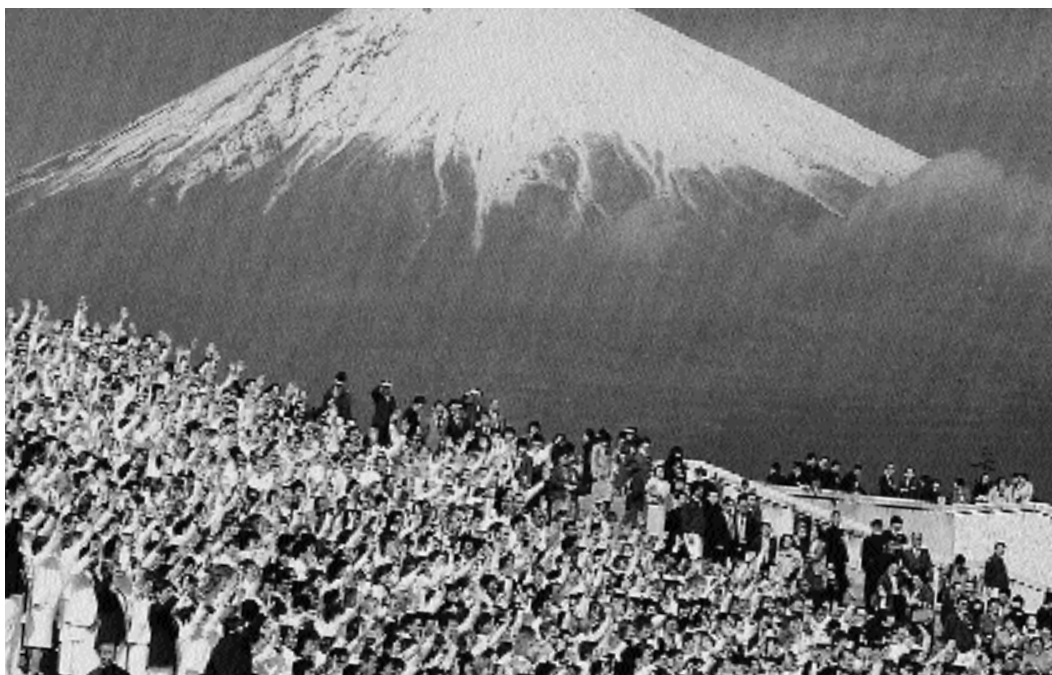
1985, membri della Soka Gakkai Internazionale in visita al tempio principale

golarmente i membri della Soka Gakkai, come in una storica riunione del Kansai, e iniziando pubblicamente una fitta serie di dialoghi sulla pace e sul futuro dell'umanità con moltissime personalità internazionali.