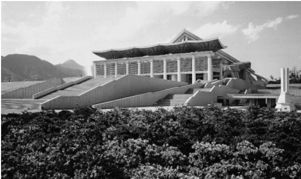
Un'immagine dello Sho Hondo

mia volontà. Mi è difficile esprimere bene le emozioni che mi attraversano. Ma nonostante tutto, dopo aver a lungo riflettuto, la cosa più importante è assicurare la successione e propagare l'insegnamento di Nichiren Daishonin nel mondo intero. [...] Io non ho mai dimenticato la volontà del mio maestro».